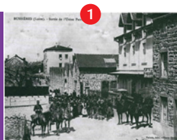
Ancienne usine Perraud Ainé