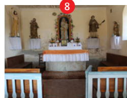
Chapelle St Roch