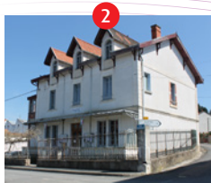
Mairie - ancienne maison patronale