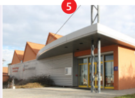
Musée du Tissage et de la Soierie

Visite du Musée du Tissage et de la Soierie